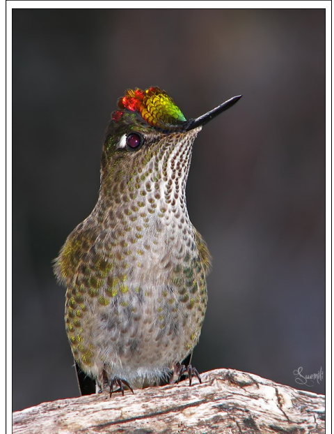
San Martín de los Andes en la Patagonia Argentina

feeder for the next three days. White caps on Long Island Sound and roofers on my building did not deter her from her many meals. I made sure there was plenty of high octane sugary juice for her and she seemed pleased, sitting and sipping quite contentedly. It was amusing to watch her acrobatics as she hung on in the stiff winds.